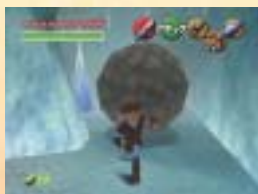
白い風景には不釣り合いな岩が...

最後のボスだつたホワイトウルフボスはザコ敵としてタンジョンのあちこちに現れる。ボスはスタルフォスだ